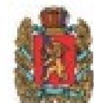
Минкомсвязь Красноярского края